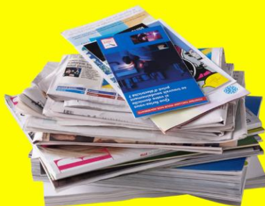
Journaux et magazines