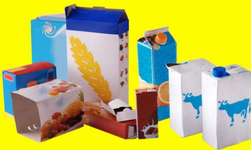
Cartons et briques alimentaires