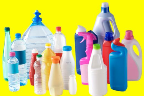
Bouteilles et flacons en plastique