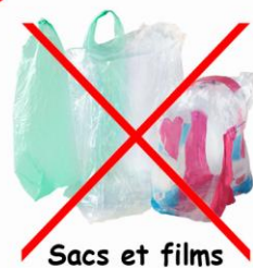
Sacs et films en plastique