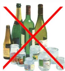
Bouteilles en verre Pots, Bocaux